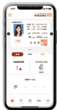
ミライロID ホーム画面