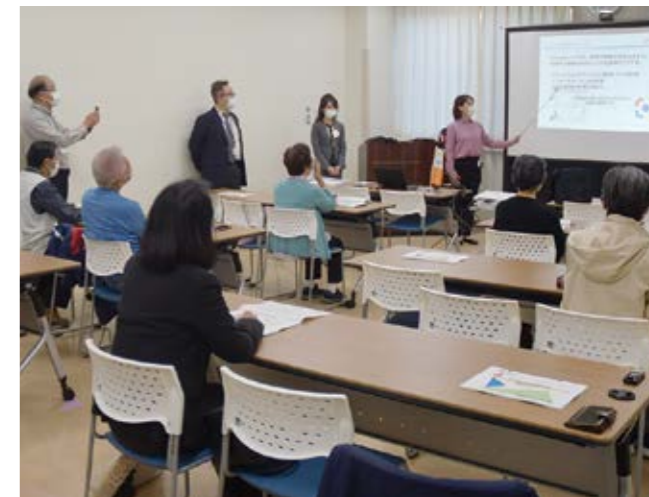
市民向けのスマートフォン講座を実施しています

企画財政部長 市内のボランティア団体が中心となり、スマホ・パソコン質問コーナーや市民向け講座を実施している。