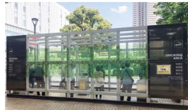
改善された喫煙ボックス (浦和駅西口伊勢丹前)

議員 市内喫煙所における受動喫煙防止策は長年の市民要望である。市長へ早急に改善を求める。